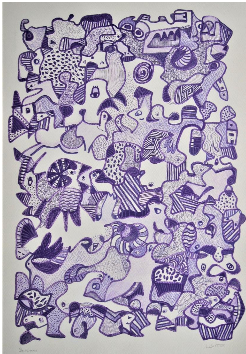
« Parmi nous », série des glyphogrammes, gouache et crayon sur papier canson septembre 2020 © Béatrice Libert