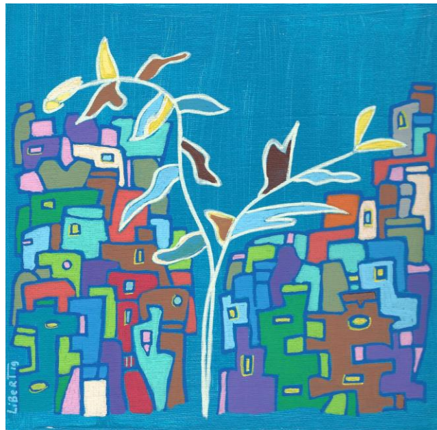
© Béatrice Libert, « Au fond du bleu », série des villes imaginaires, n° 96, 2019 ; acrylique sur carton entoilé, 20 X 20 cm.