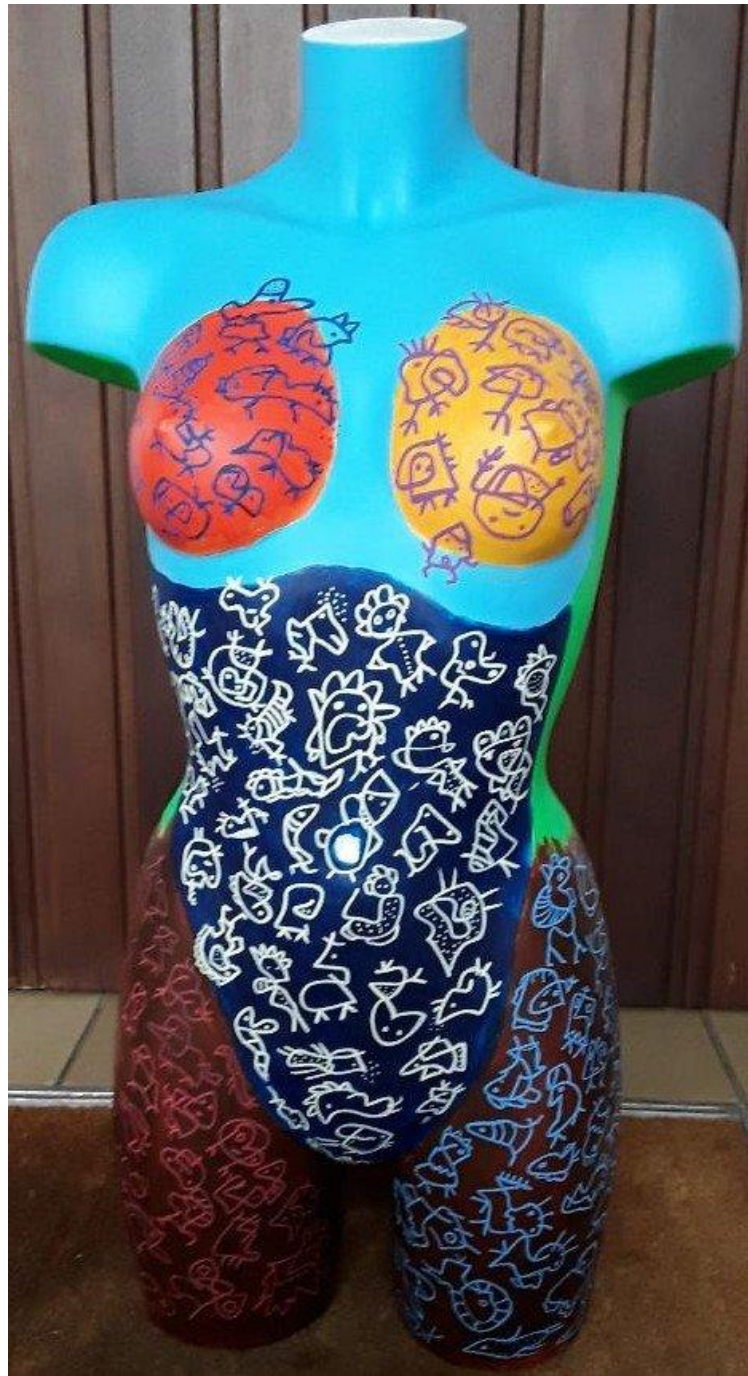
© Béatrice Libert, « Fruit défendu », acrylique sur bois, 2021.